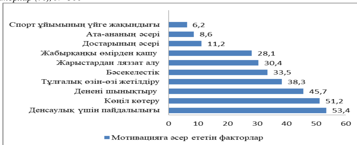
Сурет 1. Жасөспірімдердің спортпен айналысу мотивациясына әсер ететін негізгі факторлар (%), N=300

*Ескерту. Респонденттерге бірнеше жауапты белгілеу мүмкіндігі берілгендіктен, жалпы жауап 100%-дан асты