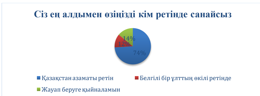
Сурет 2. Респонденттердің азаматтық және этникалық идентификация үлесі (% бойынша) Ескерту: автордың жеке дереккөзінен

Екіншіден, этникалық фактордың маңыздылығы толық жойылмаған. Респонденттердің 12%-ы үшін ұлттық тегі негізгі идентификациялық маркер болып қала береді. Бұл үлес азаматтық идентификациямен салыстырғанда төмен болғанымен, этникалық компоненттің саяси әлеуметтену процесіндегі рөлін жоққа шығармайды [9]. Керісінше, бұл деректер полиэтникалық қоғам жағдайындағы саяси идентификацияның көпқабатты сипатын айқындайды. Жастардың бір бөлігі үшін этникалық бірегейліктің басымдығы отбасы, діни орта және ұлттық мәдениет сияқты дәстүрлі әлеуметтену агенттерінің ықпалының сақталғанын көрсетеді. Ұсынылған деректер қазақстандық жастардың саяси идентификациясы күрделі әрі көпдеңгейлі болғанымен, оның негізінен азаматтық сипатқа ие екенін дәлелдейді. Азаматтық және этникалық идентификация арасындағы арақатынас мемлекеттік институттар мен дәстүрлі құндылықтардың өзара ықпалының белгілі бір тепе-теңдігін білдіреді. Аталған тепе-теңдікті сақтау – жастардың саяси әлеуметтенуінің тұрақтылығы мен саяси жүйенің легитимділігін қамтамасыз етудің маңызды шарты болып табылады. (Сурет 2)