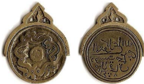
Аллага құлшылық етуші Досмухаммад ұлы Молла Қашақ Хиджра жыл санауы бойынша 1248 жыл.