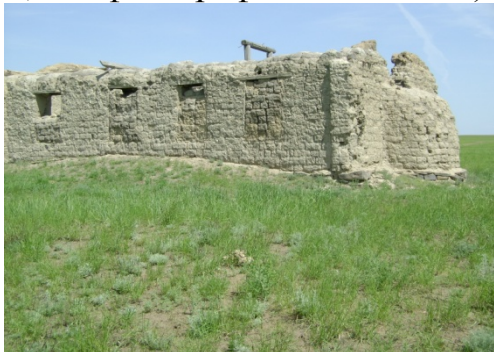
(№ 2 фотография его мечети)

С 1928 года был в изгнании за распространение духовного учения «как враг народа», позднее в 1951 году был сослан в Иркутск, реабилитирован в 1956 году после смерти Сталина.