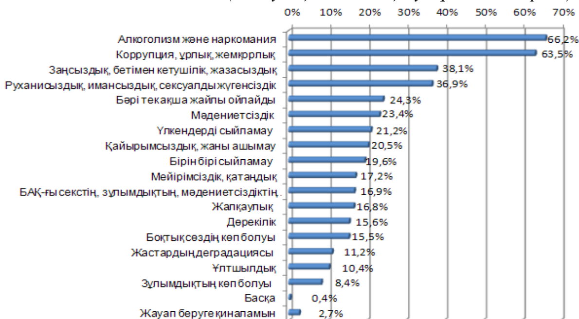
Диаграмма 2. Сіз моральдық саладағы қандай мәселелер қазіргі күні мейлінше өзекті деп ойлайсыз? (5 жауапқа дейін таңдау мүмкіндігі берілді)

Жоғарыдағы тізімде тағы бір назар аударуды қажет ететіні – респонденттердің 17%-ның қазіргі БАҚ моральдық тұрғыдан алғанда зиянды дүниелерді насихаттау арқылы қоғамға теріс әсерін тигізіп отыр деп ойлауы. Бұл көрсеткіш БАҚ-тың белгілі бір шамада жалпы аудиторияда теріс құндылықтардың тарауына және сол арқылы рухани өмірге қауіп төндіріп отырғандығының белгісі. Алайда, алынған рейтингіде әлеуметтік сипаттағы мәселелердің алдыңғы орынға шығуы қоғамдық санада моральдық проблемалардың деңгейін айқындап отыр. Бірінші кезекте қоғам мүшелерін мемлекеттің әлеуметтік және саяси дамуына кедергі келтіріп отырған кеселдер толғандыратындығы анық.