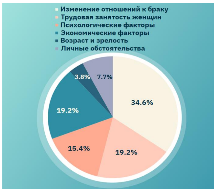
Рисунок 1 – диаграмма опроса с целью выявления мнения населения о главных факторах демографического кризиса (2024 год)

Для выяснения основных причин возникновения демографического кризиса в Южной Корее был проведен не только анализ различных источников информации, но и также проведен опрос среди граждан, включая друзей, знакомых и преподавателей, проживающих в стране (рис.1). Целью опроса было выявить мнение населения о том, какие основные факторы повлияли на снижение численности населения в Южной Корее. Опрос был совершен в онлайн-формате, в виде мини-теста на двух языках: английский и корейский. В опросе приняло участие 26 человек, и были получены следующие результаты: